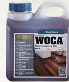
Pflegöl in vers. Farben erhältlich