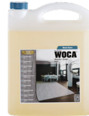
Meisterseife (Objektbereich) für die tägliche / wöchentliche Reinigung