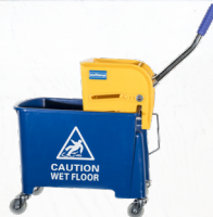
Eimer mit Auswringvorrichtung