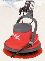
Cleanfix Floormac optional, für maschinelle Verarbeitung