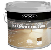
Hartwaxöl Swift Filmbildendes Hartwaxöl