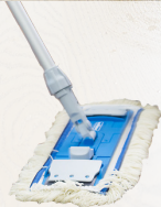
Multi Mop NG2 Baumwoll-Fransen