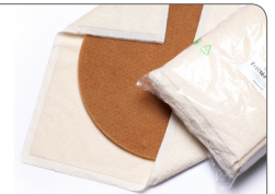
Frottéetücher für eine perfekte Endpolitur