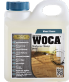
Holzbodenseife für die Reinigung/Pflege nach Bedarf