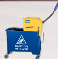
Eimer mit Auswringvorrichtung