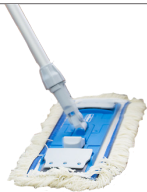
Multi Mop NG2 für die Nassreinigung