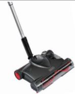
Cleanfix FloBe 2 Kabellose Kleinkehrmaschine