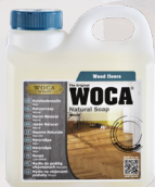
Holzbodenseife Natur / Weiss / Grau / Schwarz