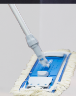
Multi Mop NG2 Baumwoll-Fransen