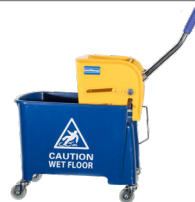
Eimer (mit Auswringmechanik) zu Multi Mop NG2