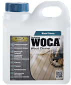
Intensivreiniger Grundreiniger für Parkett