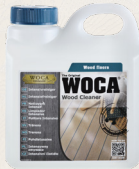
Intensivreiniger farblosen Tiefenreiniger