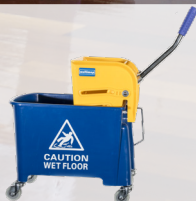
Eimer mit Auswringvorrichtung