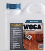
Öl-Refresher Natur / Weiss