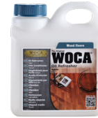
Öl-Refresher Öl-Pflegebalsam für Parkett