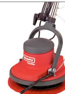
Cleanfix Floarmac für das maschinelle Nachölen