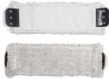
Ersatz Baumwollfranse zu Multi Mop NG2