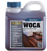
Pflegöl fürs Nachölen im Privatbereich