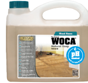
Holzseife pH-neutral für die Reinigung/Pflege nach Bedarf