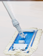
Multi Mop NG2 Baumwoll-Fransen